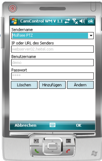
Sender anlegen, ändern oder löschen