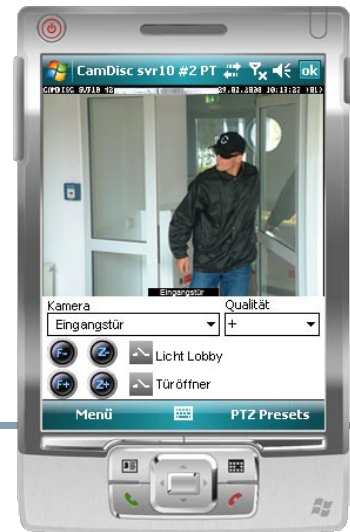
Livebildübertragung mit Kamera- und Relais-Steuerung