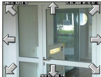
PTZ Steuerung im Live-Bildschirm

Über die CamControl WM Software können neue Sender angelegt, bestehende Namen oder Passwörter geändert und ganze Sendereinträge gelöscht werden.